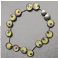
e. trenkwalder t. waidmann